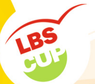
Straßenfußball für Toleranz