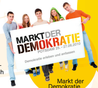
Markt der Demokratie